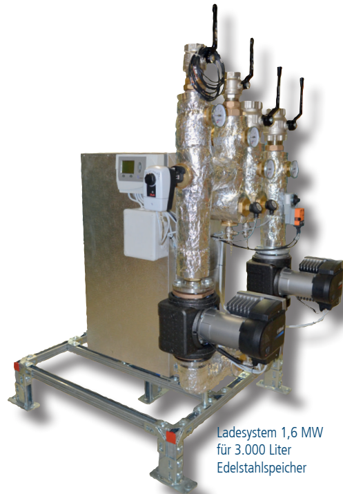
Ladesystem 1,6 MW für 3.000 Liter Edelstahlspeicher