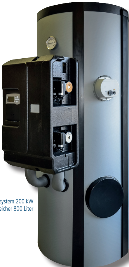
Ladesystem 200 kW mit Speicher 800 Liter