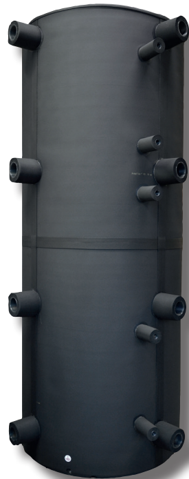
Kältepufferspeicher ohne Wärmetauscher mit Armaflex-Isolation